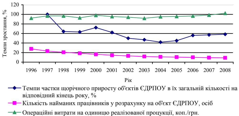
Рис. 2. Динаміка показників розвитку і задіяння потенціалу об'єктів ЄДРПОУ 1996–2008 рр.*

Щодо обсягу реалізованої продукції, то суб'єкти підприємницької діяльності спромоглися впродовж 2001 – 2008 рр. наростити його майже вдвічі у порівняних цінах 2001 р. Більше ніж у 1,8 рази зріс і прибуток від звичайної діяльності до оподаткування. Проте розрахунки темпів зростання середньорічної кількості найманих працівників, прибутку до оподаткування і обсягу реалізованої продукції з розрахунку на підприємство (рис. 2) дозволили стверджувати і про наявність зародження кризових процесів. Підставою до цього слугували ідентифікаційні порівняння тенденцій розвитку названих показників з еталонами, які засвідчують факт появи кризової ситуації [5, с. 120].